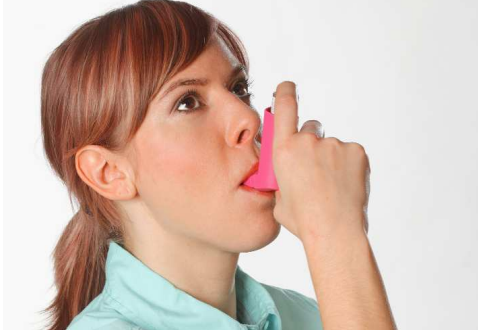
المصدر: Zeichnungen ÄZQ; Foto Kirchheim-Verlag;